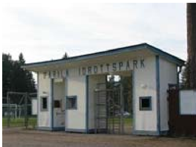
Härjedalsvägen 2 820 41 Färila

Färilaparken är en idrotts och nöjespark som har utmärkta förutsättningar för arrangemang av Jakt & Fritids Dagen. Här finns stora ytor och utmärkta lokaliteter som kompletteras med 5 st stora utställartält så alla utställare får gott om utrymme under tak, för skydd mot väder och vind.